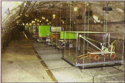
6 Galerij BELGRAND: het museum

Afvoerkanal naar de Seine stroomafwaarts van Achères