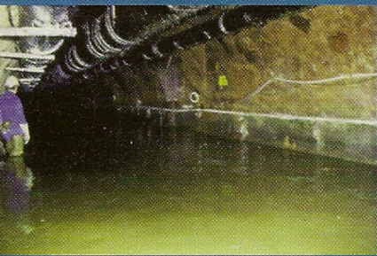
Grote hoofdriool (hoogwater)

OPMERKING: de vorm van de plattegrond voor het bezoek (het rooskleurige deel) stelt een dwarsdoorsnede voor van een grote hoofdriool. Het afvalwater stroomt door het kleinere gedeelte, de zogenaamde 'cunette'.