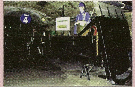
4 Boot voor het ruimen